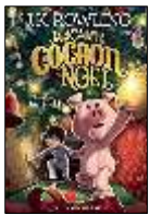
Jack et la grande aventure du cochon de Noël , ROWLING, J.K.

Pour cette deuxième rencontre, les papoteurs ont donné de la voix ! Nous avons lu de courts passages de livres. Retrouvez les ouvrages en question.