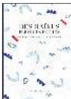
Des haïkus plein les poches , CAZALS, Thierry