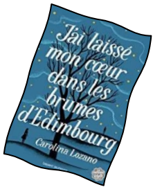
J'ai laissé mon cœur dans les brumes d'Edimbourg (LOZANO, Carolina)