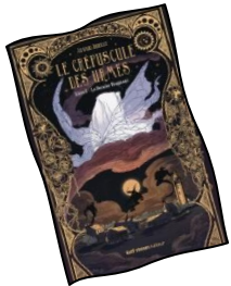
Le crépuscule des urmes (DRUELLE, Arnaud)